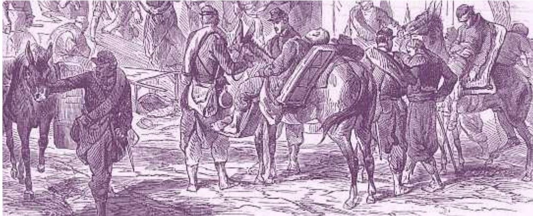
Transport des blessés sur des cacolets

Sur le front des combats, le transport des blessés se fait sur des cacolets ou des litières portés à dos de mulet que l'on appelle ambulance volante. Lorsqu'un blessé tombe dans les rangs, il est porté quelques pas en arrière, où les muletiers le prennent en charge. Le chirurgien du bataillon qui accompagne l'ambulance volante le couche sur une litière ou le fait asseoir dans le cacolet. Le blessé est ensuite transporté vers des ambulances placées hors de portée des boulets de canon. Là chacun, qu'il soit officier ou soldat, attend son tour pour être soigné. Après les premiers pansements, l'évacuation a lieu par les bâtiments de la flotte vers Constantinople.