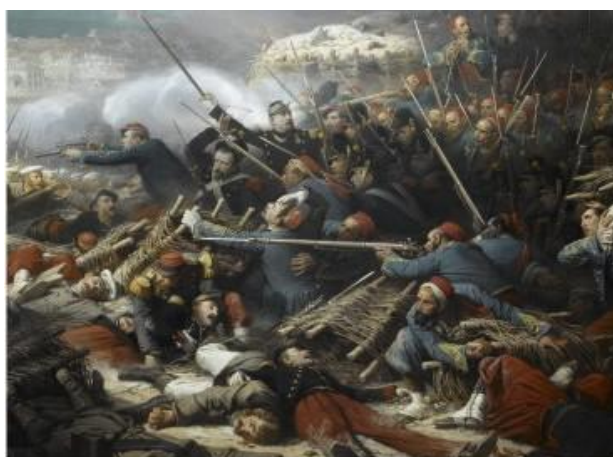
Le siège de Sébastopo

(D' après aleph99 TV, la chaîne de la Géopolitique et de l'Histoire ).